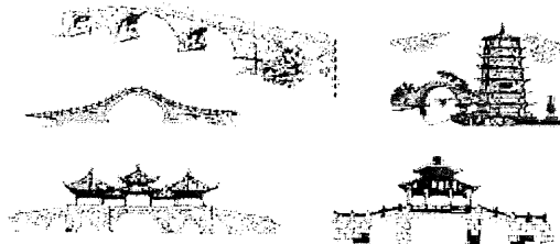
Gambar Rajah 2

Gambar Rajah 2 menunjukkan seni bina dan kemajuan Tamadun 'X'. Ia mempunyai sistem kemasyarakatan dan pemerintahan yang kukuh serta telah memberi sumbangan besar kepada dunia.